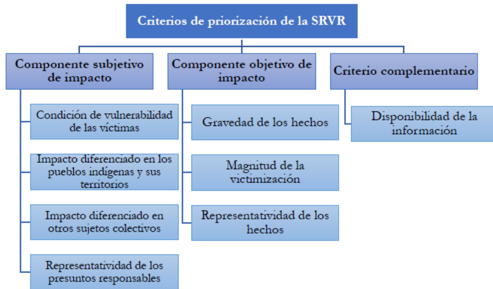
Gráfica 2. Criterios de priorización de la SRVR

Boletín #11 del Observatorio sobre la JEP. Elaboración a partir de la guía de Criterios y Metodología de Priorización de Casos y Situaciones en la Sala de Reconocimiento de Verdad, de Responsabilidad y de Determinación de los Hechos y Conductas