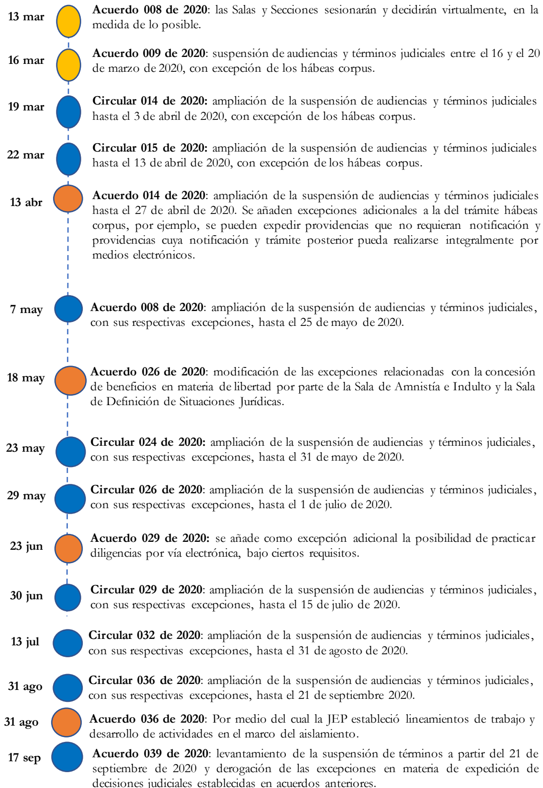
Gráfico 1. Medidas adoptadas con ocasión de la pandemia de covid-19 en 2020