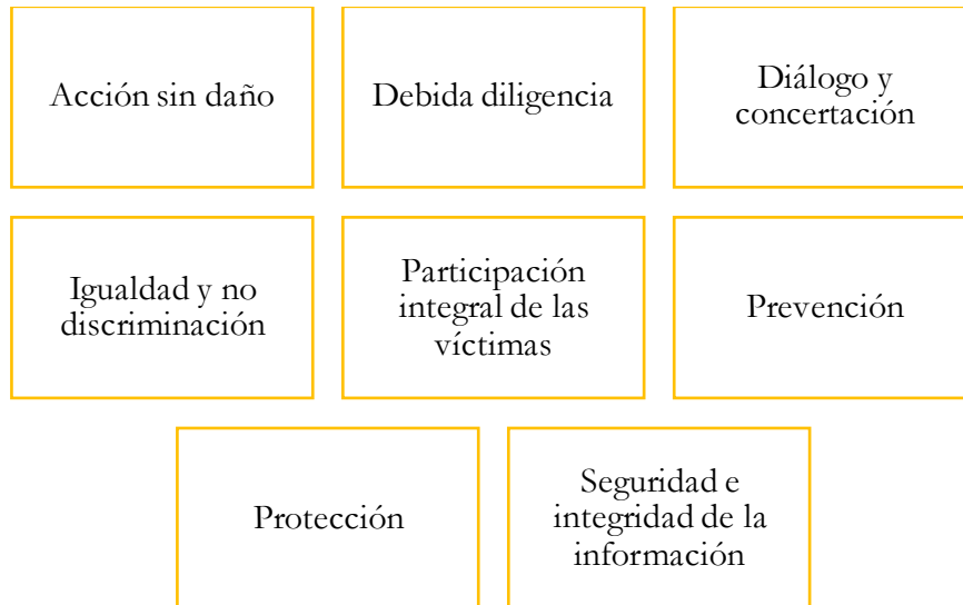
Gráfico 3. Principios orientadores de la participación de las víctimas

(Elaboración propia a partir del Manual para la participación de las víctimas ante la JEP)