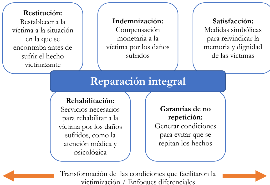
Gráfico 1. El derecho a la reparación integral de las víctimas

(Elaboración propia a partir de la Corte Constitucional, sentencia C-795/2014 (oct 30), M.P. Jorge Iván Palacio Palacio)