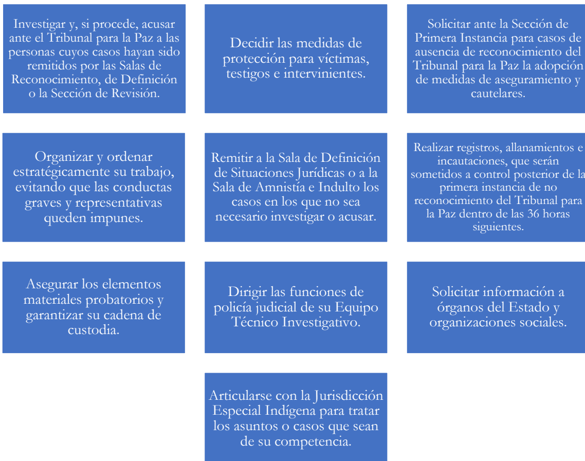
Gráfico 1. Funciones de la UIA

(Elaboración propia a partir del art. 87 de la Ley 1957 de 2019)