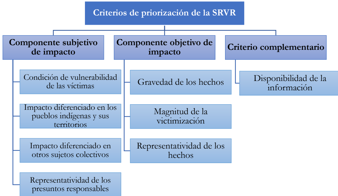
Gráfico 2. Criterios de priorización de la Sala de Reconocimiento

(Elaboración propia a partir de la guía de Criterios y Metodología de Priorización de Casos y Situaciones en la Sala de Reconocimiento de Verdad, de Responsabilidad y de Determinación de los Hechos y Conductas , p. 10-20)